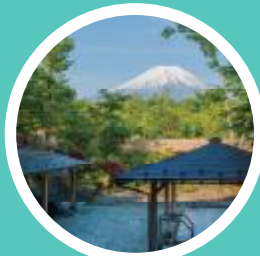
山中湖温泉 紅富士の湯