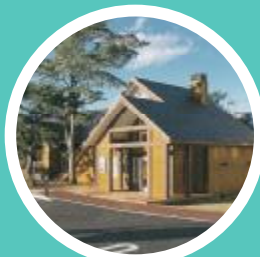
富士急リゾートアメニティ