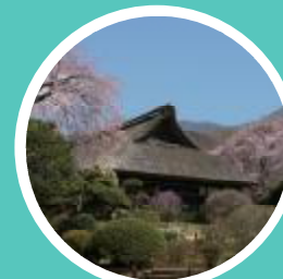
秩父宮記念公園 (御殿場)