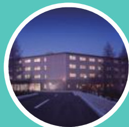
富士マリオットホテル山中湖