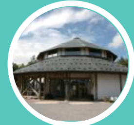
山中湖平野温泉 石割の湯