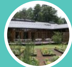
PICA山中湖ヴィレッジ