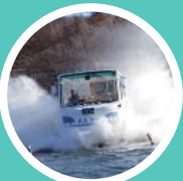
KABA BUS (森の駅)