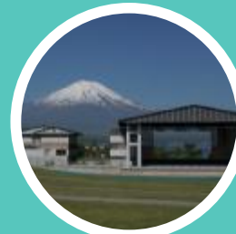
山中湖交流プラサきらら