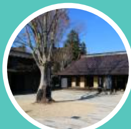
ゆいの広場ひらり