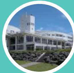
ホテルマウント富士