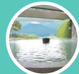
ごてんば市温泉会館